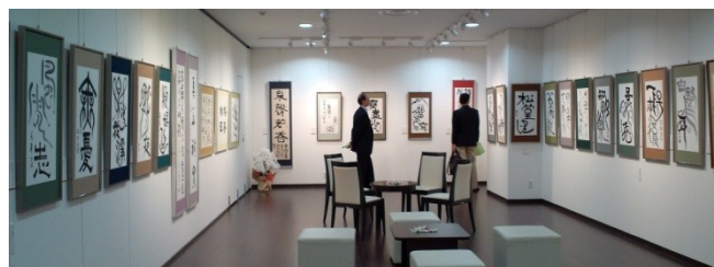
松本子游会長、故筑峯会長作品